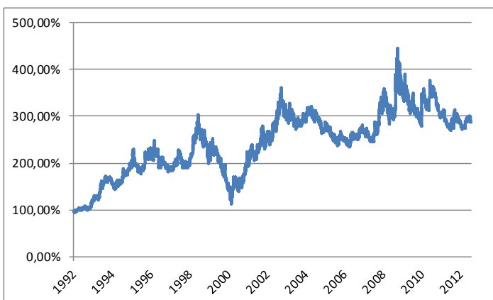
Berkshire Hathaway: Kursentwicklung relativ zu Aktien Nordamerika Vergleichsindex für die relative Kursentwicklung ist der STOXX® North America 600 Total Return

Seit 1999 wurde die Gesellschaft sukzessive umgewandelt, was möglicherweise mit steigender Skepsis von Buffet gegenüber der Funktionsweise der Finanzmärkte zu tun hat: Der Fokus verschob sich auf die außerbörslichen Beteiligungen. Arbitrage-Geschäfte wurden beendet und starke Risikokonzentrationen zurückgeführt. Damit ist die Gesellschaft sehr viel defensiver aufgestellt als früher.