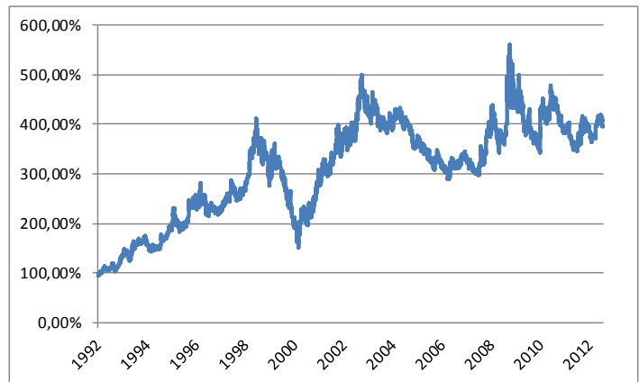
Berkshire Hathaway: Kursentwicklung relativ zu Aktien global Vergleichsindex für die relative Kursentwicklung ist der STOXX® Global 1800 Total Return

Zunächst muss man darauf vertrauen, dass Buffet und sein ebenfalls hochbetagter Partner Charlie Munger für sich eine qualifizierte Nachfolgeregelung finden. Dies ist nicht so einfach, eben weil Buffet nicht nur ein sehr guter Fondsmanager ist. Diese sind zwar auch nicht gerade häufig, es gibt aber immer noch genug, die für eine solche Aufgabe infrage kommen. Buffet als Unternehmer, der immer wieder neue Möglichkeiten entdeckt und ein Gespür dafür hat, wann man sich an Regeln halten soll und wann man sie besser bricht, wird sehr viel schwerer zu ersetzen sein.